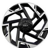
19" aluminiumfälg (GT Line)