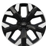
19" aluminiumfälg (Action & Advance)