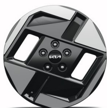
EV3 17" aluminiumfälgar 215/60 R17