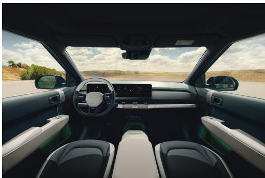
EV3 GT LINE Long Range Konstläder Mörkgrå/Vit