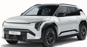
Snow White Pearl [SWP] metallic (pearleffekt)