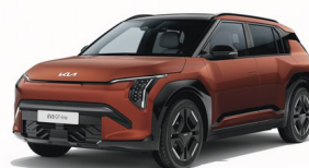
Terra Cotta [TCT] metallic