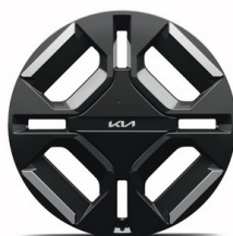
EV3 GT Line 19" aluminiumfälgar 215/50 R 19