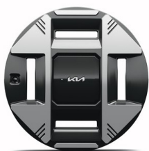
EV3 Plus 19" aluminiumfälgar 215/50 R 19