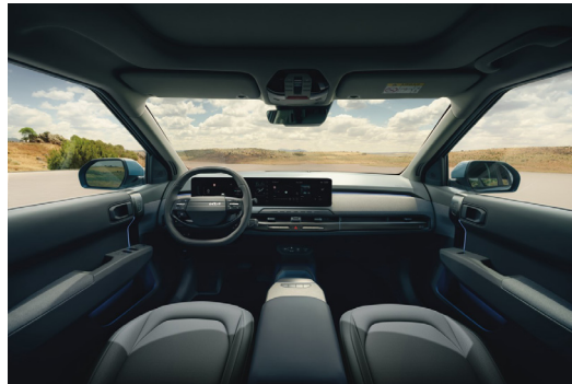
EV3 Plus Long Range Konstläder Mörkgrå/grå