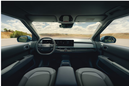
EV3 Standard Range/Long Range Tygklädsel Mörkgrå/grå