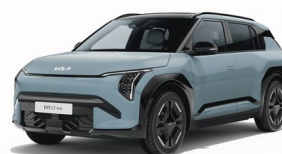
Frost Blue [EBB] solid