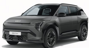
Shale Gray [EBD] metallic