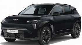
Aurora Black Pearl [ABP] metallic (pearleffekt)